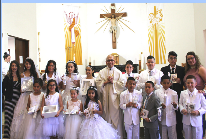
FIRST COMMUNION GROUP!