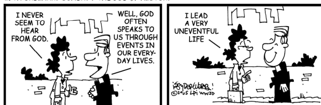
29TH ORDINARY SUNDAY / THE GOD OF HISTORY

Los programas, servicios y ministerios mantenidos por la Campaña Anual de Cooperación Diocesana tienen como fin cumplir con las necesidades de los católicos aquí en la Diócesis de Yakima. La Iglesia nos sirve a todos nosotros, y nuestro apoyo monetario es muy necesario para continuar la obra de Dios aquí en Washington Central. Por favor considere piadosamente.